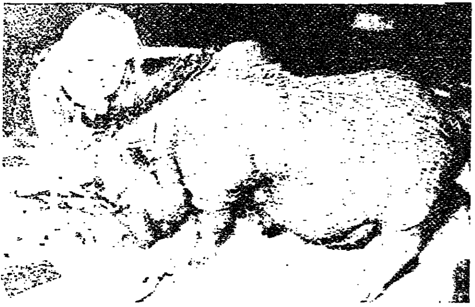
الكنتزيرة «اومارا» ذات الكرش الكبير وهي تتناول ان «اومارا» من منشا سويدي وقد فازت بجائزة كبرى في جنوب الزيب تحت إشراف صاحبها كيمبري ديفو في إحدى المياريات. وانها رفضت التخل عنها مقابل ٢٠ غيلروي (كاليفورنيا) - ر